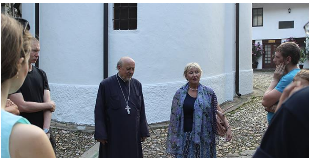
Бела Црква – Блажево Јул, 2018.