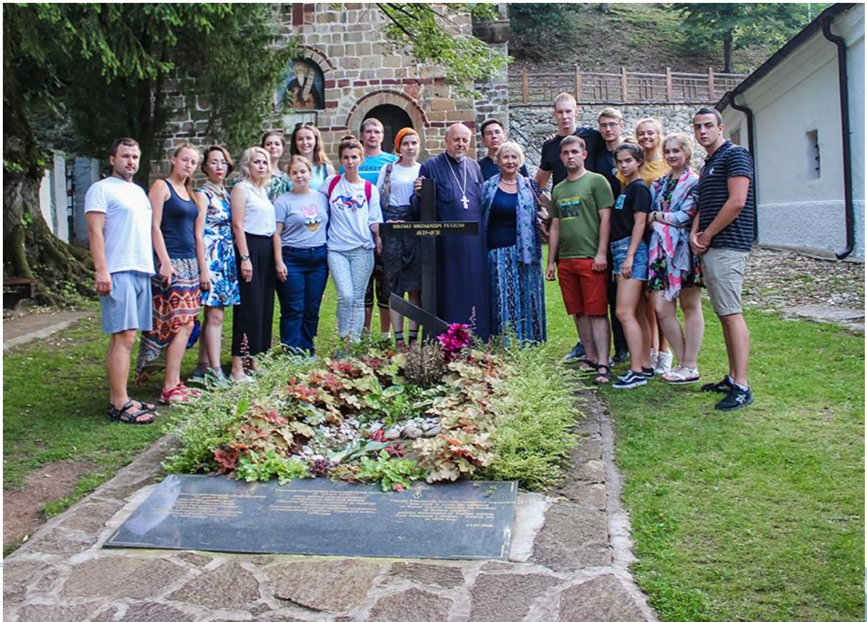
Бела Црква – Блажево Јул, 2018.