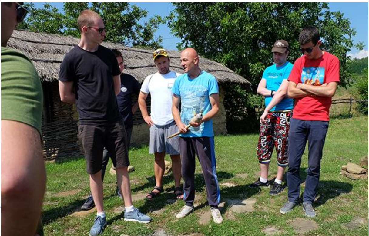
Бела Црква – Блажево Јул, 2018.