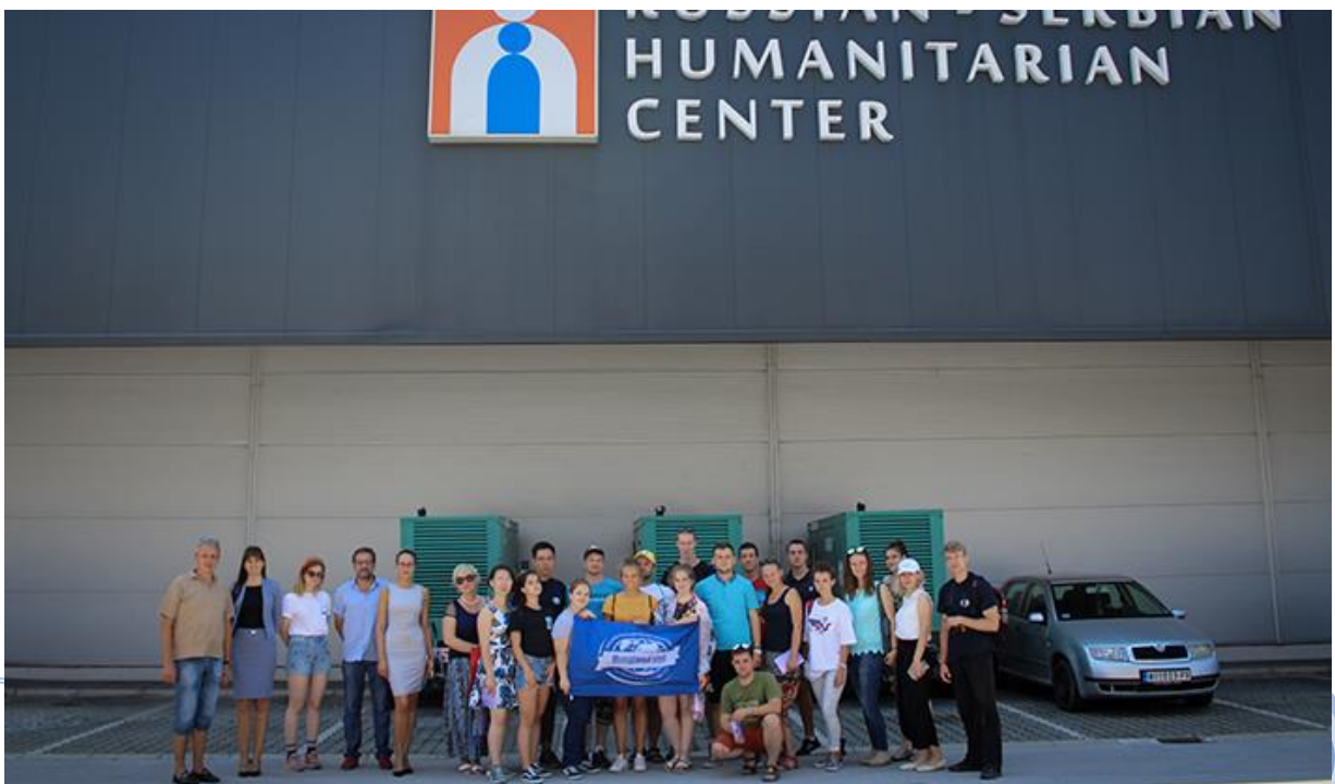
Бела Црква – Блажево Јул, 2018.